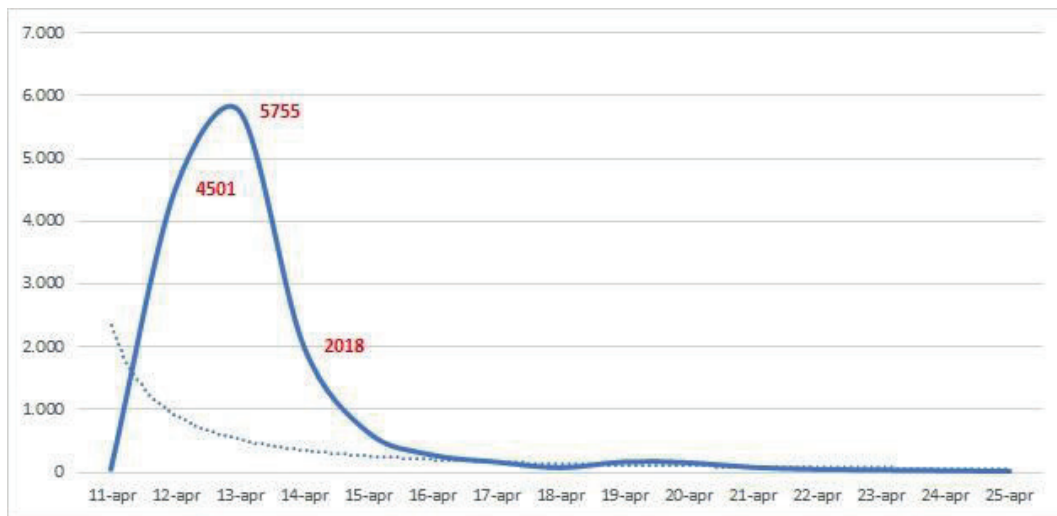
Figura 7 – Numerosità delle risposte nel periodo di 15 giorni della somministrazione del questionario.

La numerosità delle risposte pervenute segue, allora, un normale andamento decrescente, che si è voluto evidenziare nella figura precedente rappresentandola graficamente dalla curva tratteggiata che esprime, infatti, la linea di tendenza logaritmica delle risposte al questionario. Tale curva, definita dalla letteratura statistica ottimale, è stata esposta in quanto la velocità di ricezione delle risposte è stata molto rapida e con tutta evidenza concentrata in un picco statistico desumibile dalla classica forma a campana della curva espressa dalla linea azzurra che raffigura la numerosità delle risposte fornite dagli operatori e professionisti afferenti agli Ordini TSRM e PSTRP.